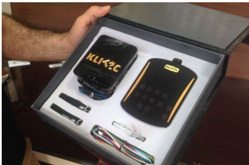
آموزش نصب قفل دیجیتال – محتویات بسته بندی

آموزش نصب قفل دیجیتال در برند های مختلف متفاوت می باشد. قفل دیجیتال کلیتک از دو پنل کدینگ و کنترلر تشکیل شده است که پنل کدینگ در کنار درب مورد نظر و پنل کنترلر در داخل اتاق و معمولاً پشت پنل کنترلر نصب می شود. قاب پنل کدینگ طوری طراحی شده است که می توان آن را هم به صورت روی کار و هم به صورت توی کار نصب کرد. بنابراین اگر ساختمانی دارید که کارش به اتمام رسیده و مایل به نصب قفل دیجیتال کلیتک در کنار درب آن می باشید جای نگرانی نیست. با مطالعه مطالب زیر که طی تجربه ی چندین ساله ی شرکت کلیتک می باشد و دیدن فیلم های آموزش نصب قفل دیجیتال که در زیر این مطلب برای شما قرار داده ایم می توانید طریقه نصب قفل دیجیتال کلیتک را به خوبی فرا گیرید. البته بهتر است برای راحت تر بودن مراحل نصب قفل دیجیتال، قبل از اینکه کار ساختمان تان به پایان برسد محصول را خریداری نموده و راهنمای نصب قفل دیجیتال را مطالعه نمایید. سپس طبق دستورالعمل های گفته شده قاب زیرین پنل کدینگ را نصب کنید، لوله خرطومی هایی که برای عبور کابل و ارتباط دادن پنل ها در نظر گرفته شده را زیر کار قرار دهید و بعد از پایان کار ساختمان پنل های کدینگ و کنترلر را روی قاب مربوط به خودش پیچ نمایید.