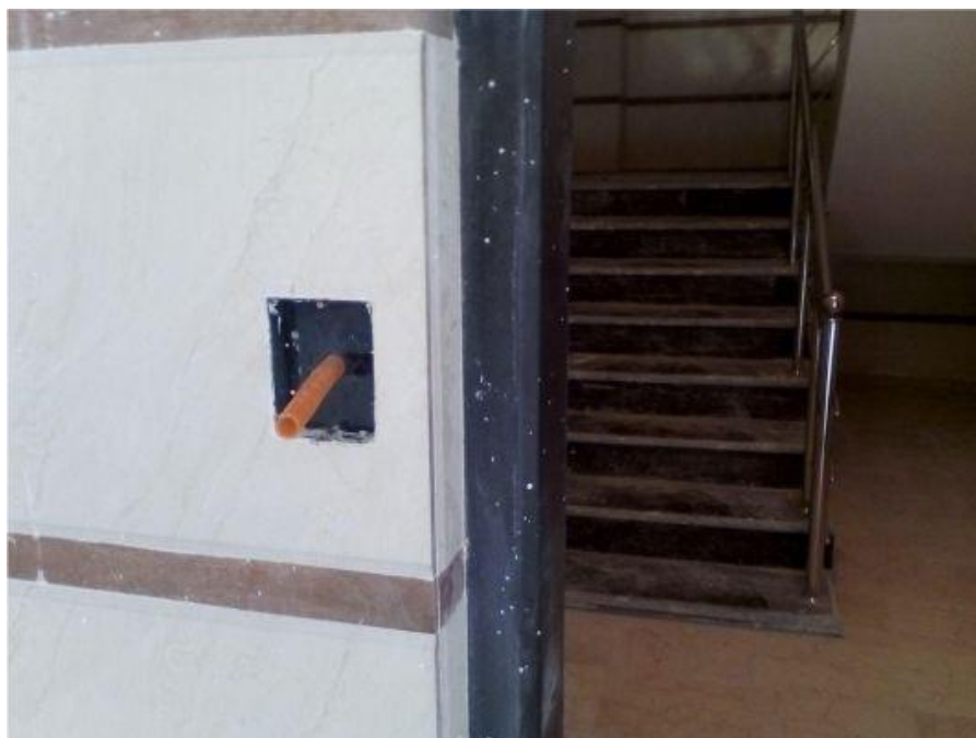
راهنمای نصب قفل دیجیتال – قاب زیر پینل کدینگ که به صورت توی کار نصب شده است

بهتر است قبل از پایان کار ساختمان، اقدامات لازم را جهت زیرسازی انجام دهید تا بتوانید به کمک آموزش نصب قفل دیجیتال که در این صفحه بیان شد، نصب راحت تر و شیک تری داشته باشید. برای این کار باید سه عدد لوله خرطومی جهت عبور سیم های دستگاه در کنار درب مورد نظر تعبیه نمایید. خرطومی اول؛ دو پینل کدینگ و کنترلر نصب شده در دو طرف دیوار را به هم وصل می کند. خرطومی دوم؛ برق ۲۲۰ ولت شهر را به پینل کنترلر که در داخل اتاق نصب شده می رساند و خرطومی سوم هم خروجی ۱۲ ولت پینل کنترلر را به داخل چارچوب درب هدایت می کند. امیدواریم آموزش نصب قفل دیجیتال کلنیک را به خوبی بیان کرده باشیم. برای خرید قفل مقابل برقی از قسمت فروشگاه اقدام نمایید و مراحل نصب آن را از صفحه ی آموزش نصب مشاهده کنید.