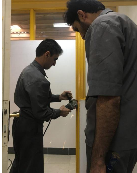
نحوه نصب قفل دیجیتال – برش چارچوب فلزی با سنگ فرز

تا اینجا آموزش تئوری نصب قفل دیجیتال را فرا گرفتیم. بعد از مطالعه ی این دستورالعمل ها جهت روشن تر شدن مطالب فیلم های آموزشی زیر را مشاهده نمایید.